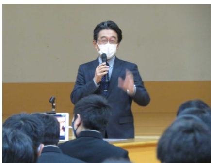
【自然との共生について】 紙谷館長