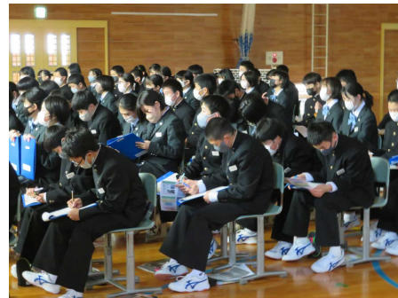
【気になるキーワードをメモする生徒たち】