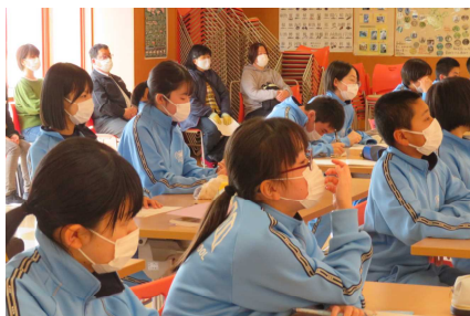
【2年生 国語科の授業参観の様子】